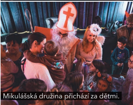
Mikulášská družina přichází za dětmi.