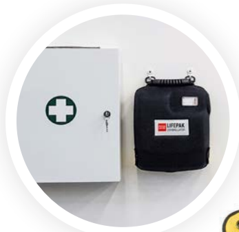
LIFEPAK 1000 DEFIBRILLATOR

DIOFLEX - Chodba 2.np ROBE Karviná - Dílna K1