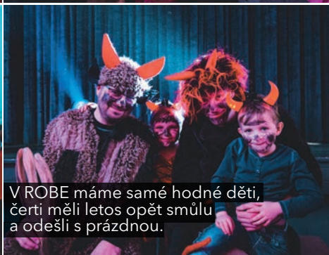
V ROBE máme samé hodné děti, čerti měli letos opět smůlu a odešli s prázdnou.