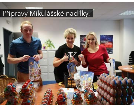
Přípravy Mikulášské nadílky.

📄 AUTOR: Petra Mrovcová