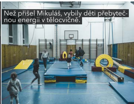
Než přišel Mikuláš, vybily děti přebytečnou energii v tělocvičně.