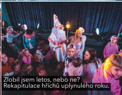
Zlobil jsem letos, nebo ne? Rekapitulace hříchů uplynulého roku.