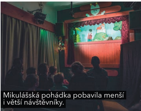
Mikulášská pohádka pobavila menší i větší návštěvníky.