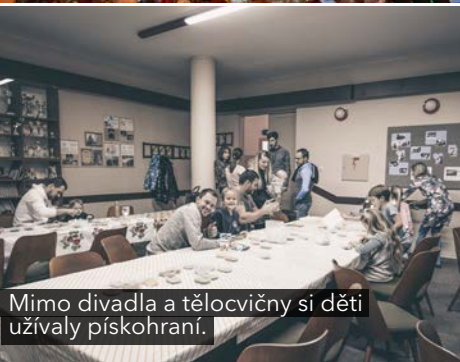
Mimo divadla a tělocvičny si děti užívaly pískohraní.