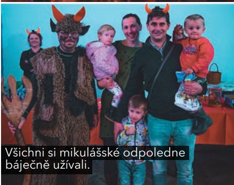
Všichni si mikulášské odpoledne báječně užívali.